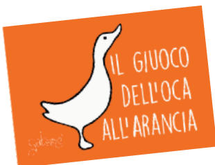
Foto d'autore per illustrare un gioco "over size", nel quale potranno divertirsi grandi e piccoli, scoprendo mille curiosità, ovviamente agrumose!